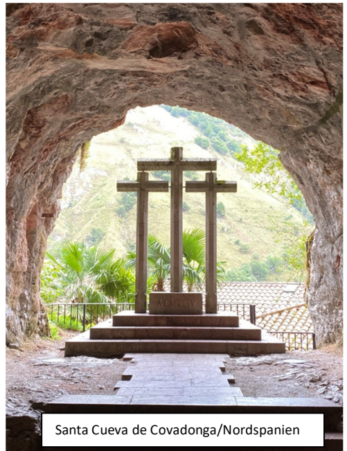
Santa Cueva de Covadonga/Nordspanien

Doch wenn wir ehrlich sind, dann gehört eine Bedrohung schon immer zum Menschsein – die größte von allen: der Tod. Er ist die Grenze, die jeder Mensch vor sich hat. Keine Technik, kein politisches System und kein Fortschritt wird diese Grenze aufheben. Ostern führt uns genau an diesen Punkt. Denn die Geschichte Jesu endet zunächst nicht triumphal, sondern im Scheitern, in Gewalt, im Tod am Kreuz.